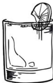
Коктейль Passion Sour: Міцний та насичений, із легкою кислінкою та цитрусовим присмаком.